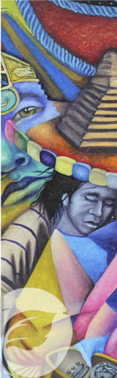
“Que aclare, que amanezca”

E l dualismo también se manifiesta en la manera en que las deidades forman parejas de manera similar a los abuelos creadores y formadores del Popol Vuj.