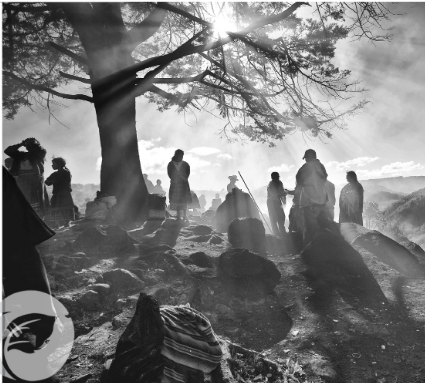
“Corazón del Cielo”.