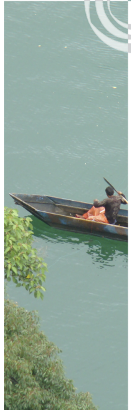
“Pescador”. Foto de Arq. José L. Menéndez