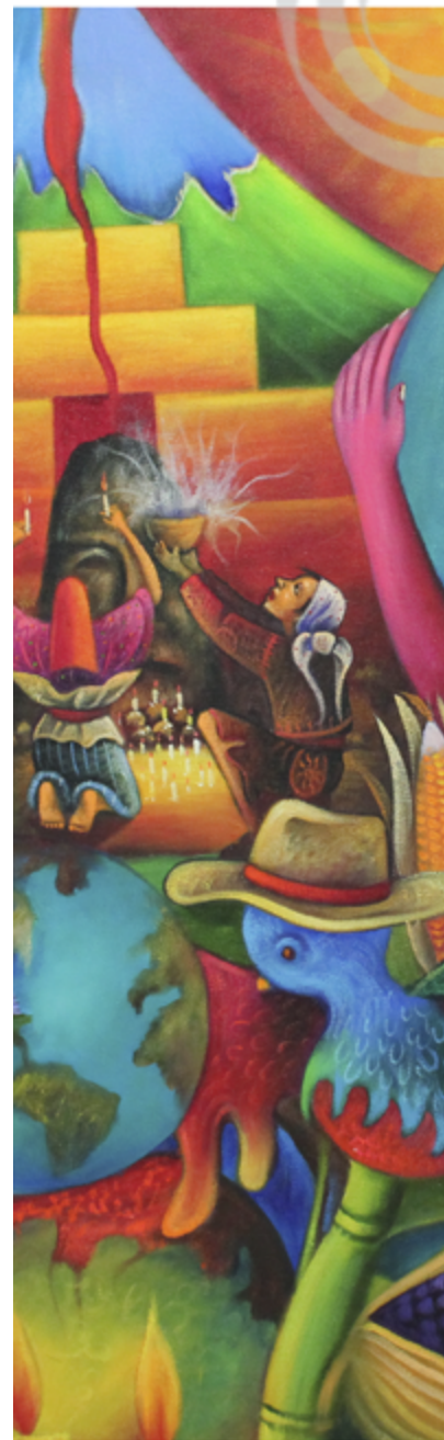
Detalle de “Cosmogonía maya”

Detalle de la obra “El inframundo de la cosmología maya”. Oleo de Julián Coché.