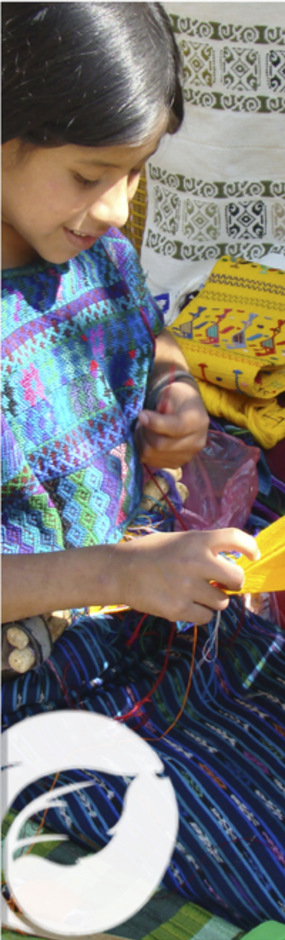
Detalle de “Niña tejedora”