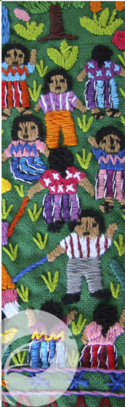
“Tejiendo historias”