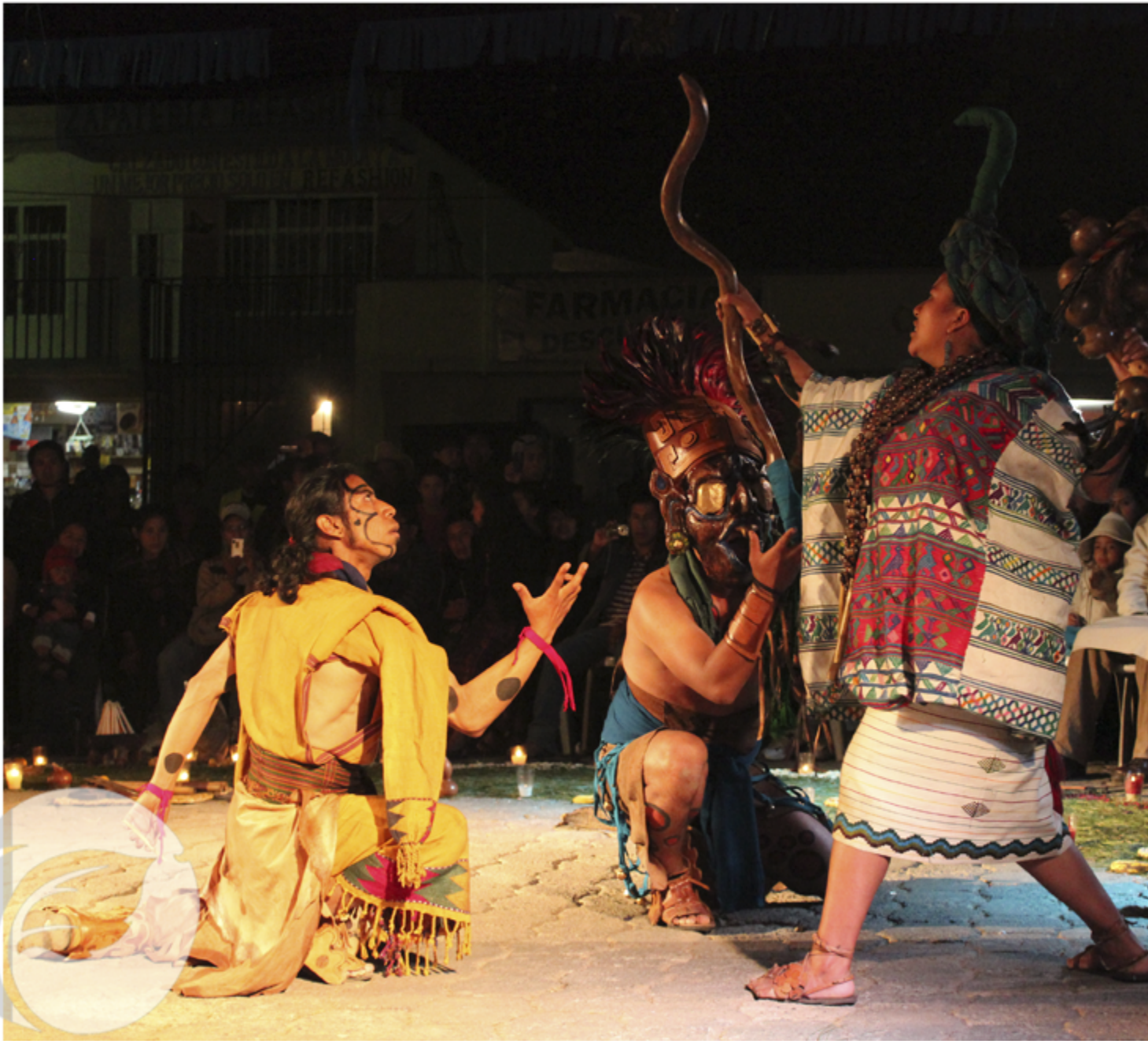
"Oxlajú Baqtum", Grupo de Teatro Sotzil Jay.