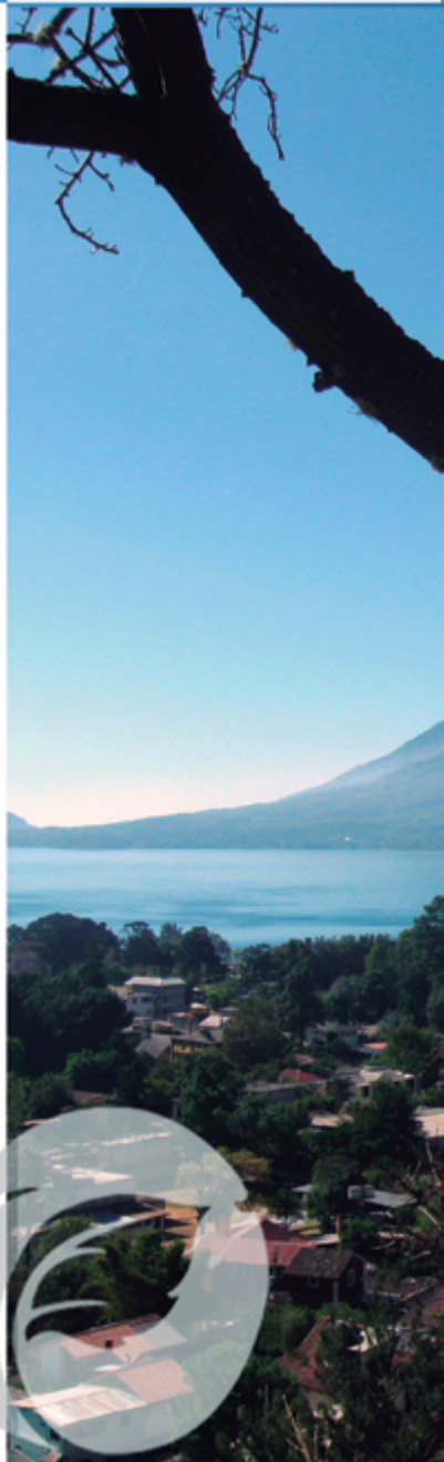
Panajachel, Sololá.