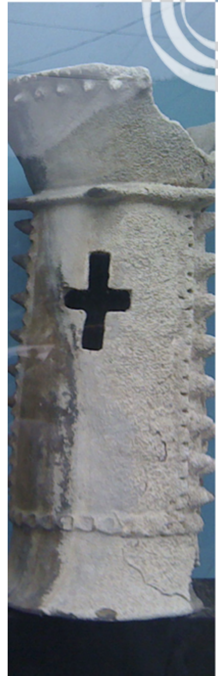
“Incensario de Panabaj”, Museo Lacustre.