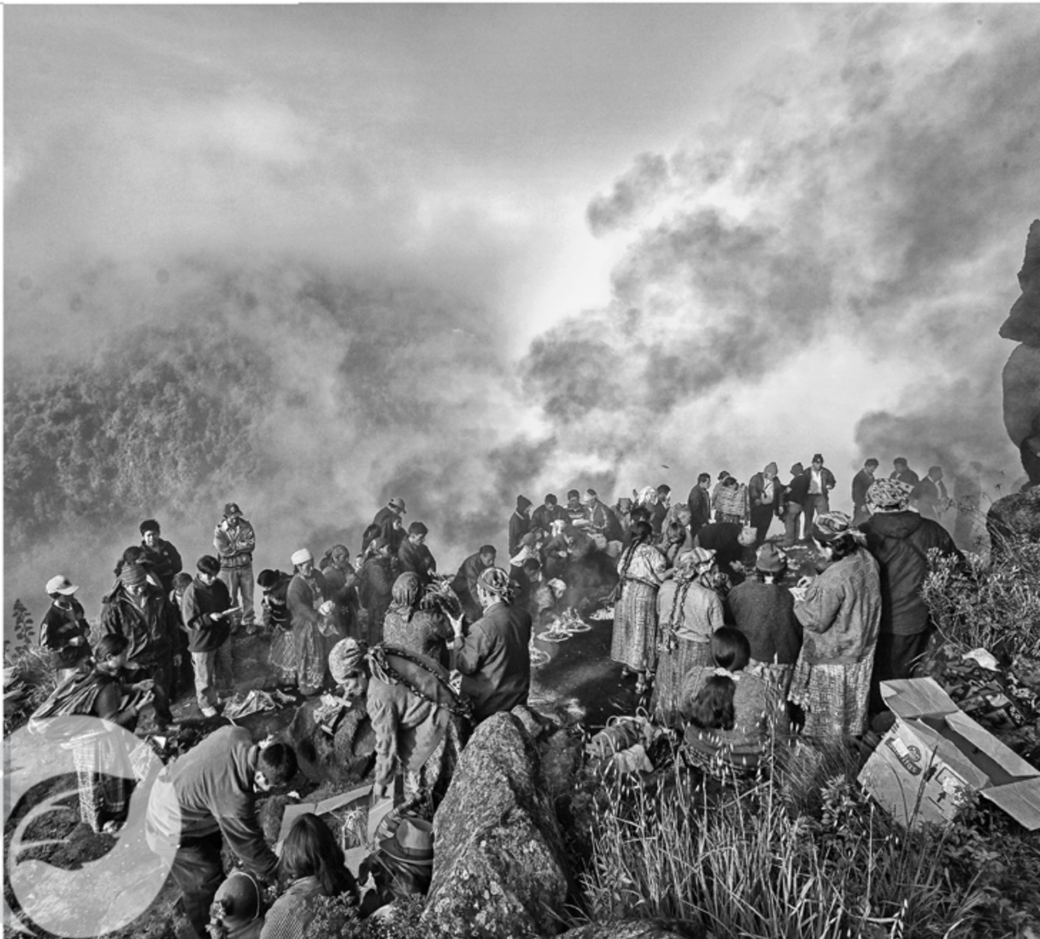
“Corazón de la Tierra”. (1er. lugar Certámen Oxlajuj Báktum 2013) Culturalmente natural ...