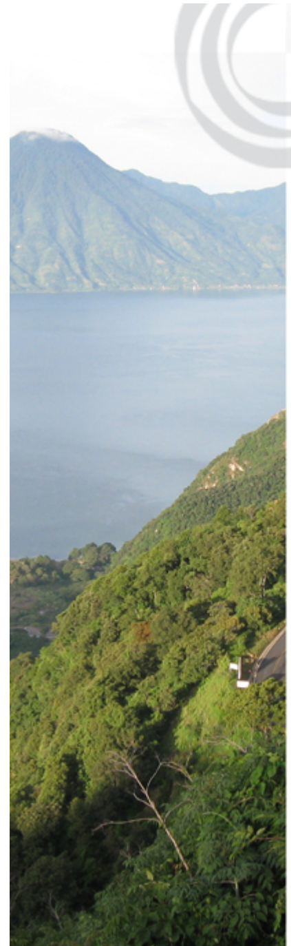
Hacia el Lago de Atitlán