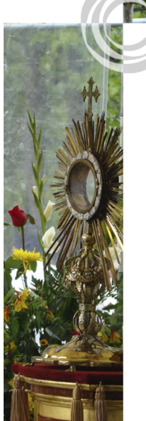
“La Cruz”. Foto de Haydee Pérez