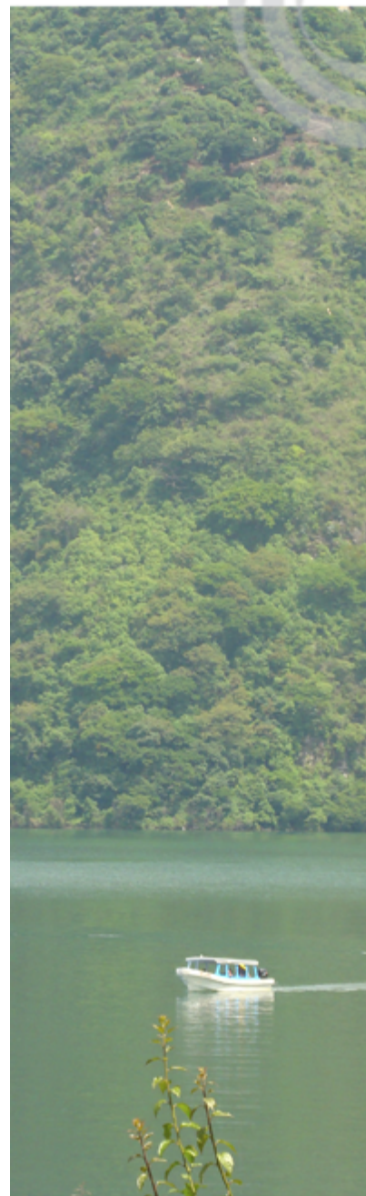
Detalle "Lancha"